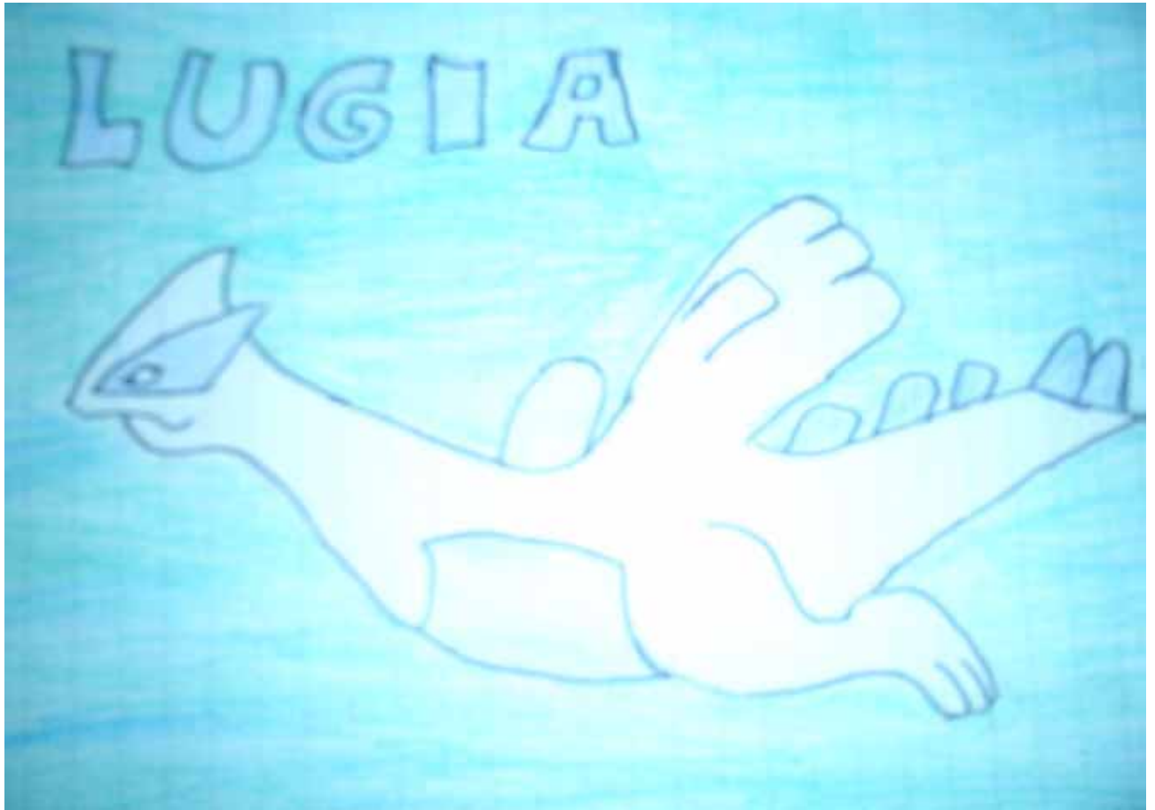
E per ultimo, ma non per importanza e bellezza, un disegno by MICIA.BLUE ( la parte in nero è il suo cognome )