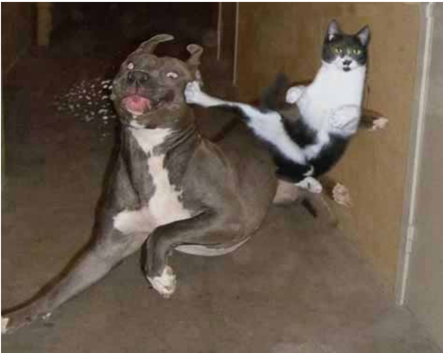
WATAAAAH!! XDD Un gatto che fa karate.

In questa sezione del giornalino,troverete tante foto pazzi! xD Se volete mandarci qualche foto pazza,potete farlo inviando un mp a Dogandcat ^^