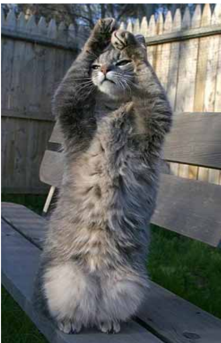
Maaow,sono un gatto atletico,io! xDD